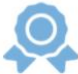
IMAGE DE L'ENTREPRISE : MONTRER SON ADHÉSION AUX VALEURS VÉHICULÉES PAR L'AUTOPARTAGE

L'autopartage permet de diminuer l'empreinte environnementale de l'entreprise par l'optimisation du nombre de véhicules mis à disposition, ou via la mise en place de véhicules propres. A ce titre, nous observons chez nos clients l'exploitation du véhicule électrique dans la majorité des projets de flottes partagées.