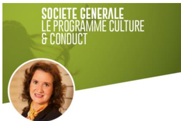
PAR CHRISTINE CLOSTRE Directeur du Programme Culture & Conduct pour la banque de détail Société Générale en France

“ La culture d'entreprise c'est comme l'eau pour un poisson : on vit dedans sans se poser de questions! ”